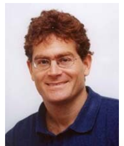
פרופ' עיריד בן-גל